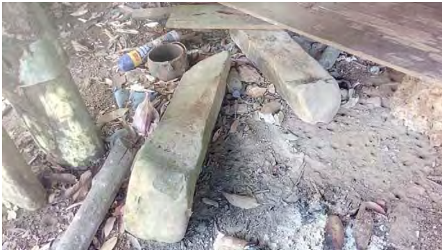
Gambar 5. Sebahagian daripada 5 objek megalitik di TM3