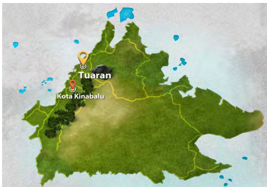
Peta 1. Kedudukan Daerah Tuaran iaitu kawasan penemuan tapak megalitik dan kubur tempayan di Sabah.

Pada bulan Mac 2018 yang lalu, penyelidik telah menjalankan satu survei di Kampung Bundu Gulu (Kampung Bundu yang terdahulu) dalam daerah Tuaran bersama-sama dengan dua orang penduduk kampung yang juga menjadi informan. Survei ini dijalankan berdasarkan kepada ingatan penyelidik sendiri dan maklumat yang diberikan oleh penduduk kampung bahawa terdapat beberapa tinggalan megalitik di kampung tersebut berserta tempayan sebagai objek pengebumian. Kampung yang terletak dalam daerah Tuaran ini berada kira-kira 30 km dari pekan Tamparuli ataupun 60 km dari Bandar Kota Kinabalu.