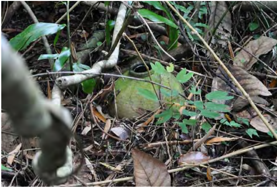
Gambar 12. Tempayan kubur di tapak KT2 yang masih sempurna.

kepada pengkaji sebelum ini merujuk kepada fungsi tempayan dalam masyarakat Kadazandusun.