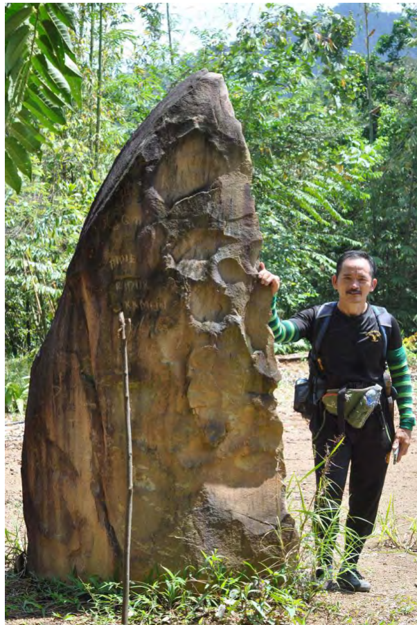
Gambar 1: Batu megalitik 1 dilihat daripada bahagian hadapan (permukaan asal batu)

Menhir ini adalah daripada jenis batu pasir halus (batuan sedimen) yang dipotong ataupun terkopek secara semulajadi sehingga membentuk sebuah bongkahan menirus. Permukaan asal batu masih jelas kelihatan, begitu juga dengan permukaan bahagian dalam. Berdasarkan kepada maklumat lisan yang diperolehi, batu megalitik ini berfungsi sebagai tingolig atau penjaga dan pelindung. Apa yang dimaksudkan dengan penjaga di sini ialah, penjaga secara spiritual kepada penduduk kampung daripada segala bentuk bencana, malapetaka, penyakit berjangkit dan niat jahat orang luar terhadap mereka. Ini sangat bersesuaian dengan kedudukan menhir tersebut di bahagian paling luar kawasan Kampung Bundu Gulu yang asal dan laluan utama untuk masuk ke kampung.