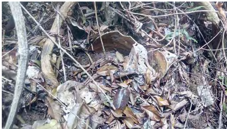
Gambar 17. Bahagian dasar tempayan KT5 yang masih tertanam.