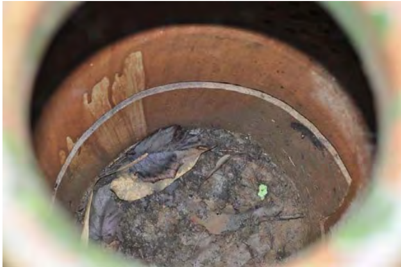
Gambar 14. Bahagian dalam KT3 yang memperlihatkan tanda ia dipotong untuk membolehkan mayat dimasukkan ke dalam tempayan sewaktu pengebumian.