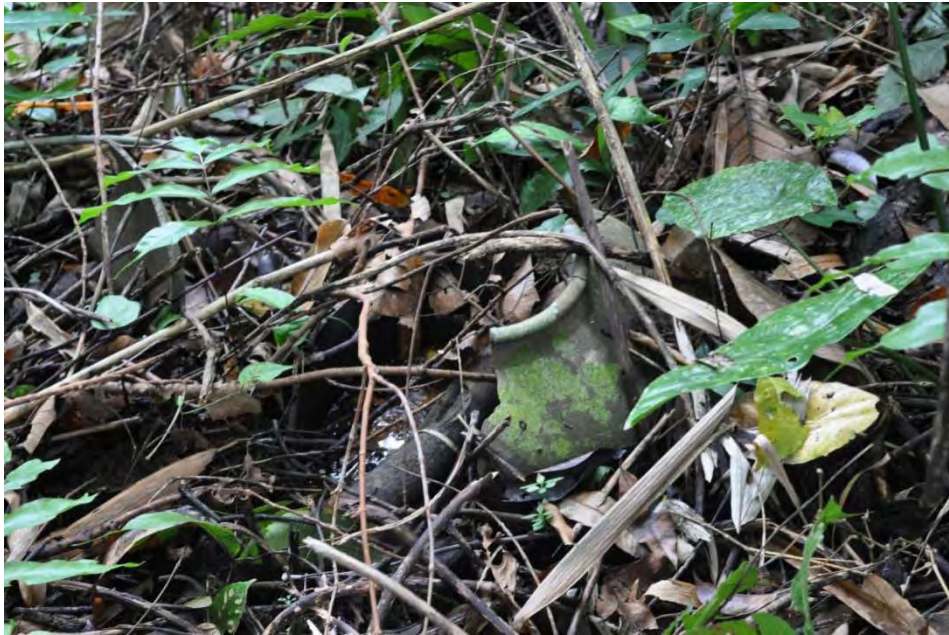
Gambar 11. Tempayan kubur yang pecah, terganggu dan tidak terurus.

Di lokasi ini, kuburnya dalam keadaan rosak dan sangat terganggu. Separuh bahagian badannya masih tertanam dan kelihatan ada air bertakung bercampur dengan sampah hutan. Bahagian atas badan tempayan terpecah dua. Sebahagiannya masih in-situ tetapi bahagian yang satu lagi teralih ke sisi. Tempayannya juga telah dipenuhi dengan lumut, oleh itu tidak dapat dipastikan jenisnya. Walau bagaimanapun, pengkaji mendapati bahawa ia bukan daripada jenis berglais / bersepuh. Kualiti agak rendah. Saiznya sederhana besar dengan diameter bahagian yang paling lebar ialah 47 cm. Memandangkan tempayan ini telah dipotong di bahagian bahunya maka tempayan ini digunakan sebagai pengebumian primer.