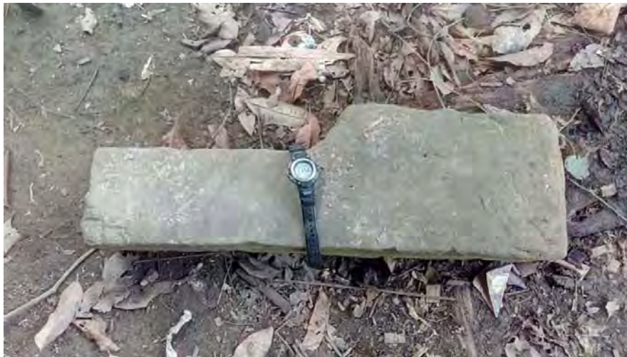
Gambar 4. Salah satu daripada objek megalitik di TM3 yang mempunyai bahagian dasar yang lebih lebar.

Di tapak megalitik 3 ini, terdapat 5 ketul batu megalitik yang dipercayai telah dialihkan dari lokasi asalnya oleh pengunjung kemudian. Kesemua objek megalitik ini adalah daripada jenis menhir dan mungkin mempunyai fungsi yang sama dengan objek megalitik di TM1 dan TM2. Pada hari ini, kesemua 5 objek megalitik itu diletakkan di bawah sebuah pondok dan dijadikan sebagai alas bangsal. Daripada pemerhatian pengkaji mendapati bentuknya menyerupai objek megalitik di TM2. Saiznya juga lebih kurang sama dengan TM2. Ia kelihatan lebih bersih kerana terlindung daripada hujan dan selalu disentuh manusia.