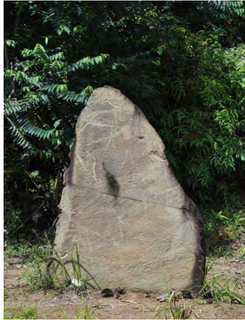
Gambar 2. Batu megalitik 2 dilihat daripada sisi belakang iaitu bahagian dalam pecahan batu.