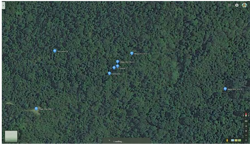
Peta 3. Lokasi tapak penemuan berdasarkan imej satelit. Kampung Bundu Gulu yang telah bertukar menjadi hutan rimba kerana telah ditinggalkan semenjak pertengahan abad-20.