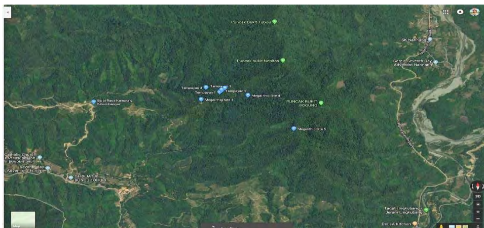
Peta 2. Lokasi dan kedudukan tapak penemuan baharu di Kampung Bundu Gulu dalam daerah Tuaran.