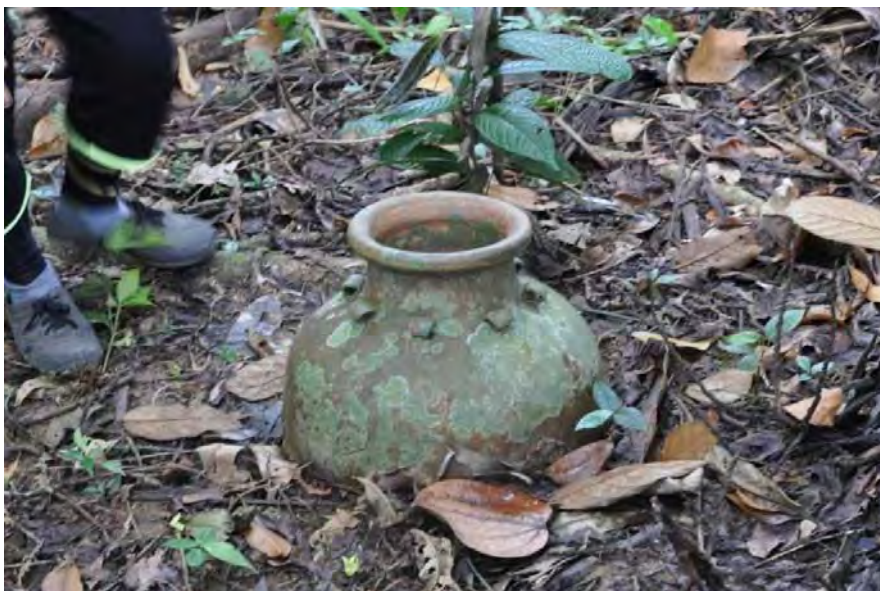
Gambar 13. Bahagian luar KT3 yang separuh tertanam.

KT3 ini terletak hanya beberapa meter sahaja daripada KT2. Secara relatifnya ia lebih cantik kerana bentuknya yang mempunyai bahagian leher yang panjang, mempunyai 8 telinga di bahagian bahunya dan bersepuh luar dan dalam. Bahagian luarnya telah ditumbuhi licon dan mempunyai tanda hiasan dengan motif naga. Bahagian dalamnya lebih bersih tetapi tidak ditemui sebarang tanda sisa rangka manusia kecuali tanah sahaja. Berdasarkan kepada kesan potongan di bahagian tengah badan tempayan, pengebumian ini adalah jenis pengebumian primer.