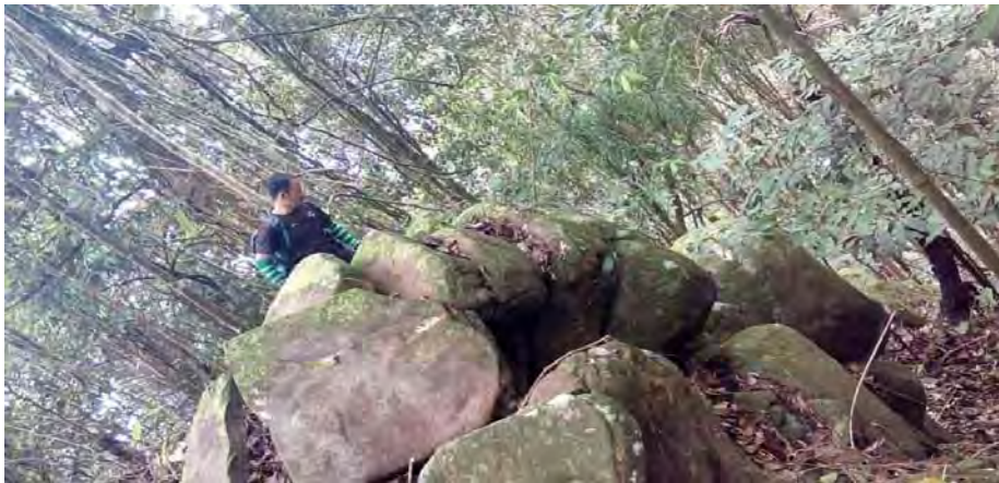
Gambar 10. 7 lapis batu yang disusun di atas puncak permatang bukit berketinggian melebihi 800 meter dari paras laut.

Dongeng yang dikisahkan itu sebenarnya hanya merupakan satu pengajaran kepada masyarakat secara umum bahawa mempersenda-sendakan makhluk lain adalah dilarang dan dianggap sebagai taboo meskipun yang dipersenda-sendakan itu hanyalah binatang. Masyarakat Kadazandusun memang kaya dengan kisah dongeng yang berbentuk pengajaran seperti ini, sebab itulah menjadi pantang larang kepada mereka untuk tidak mempersenda-sendakan binatang. Oleh yang demikian, pengkaji melihat bahawa antara fungsi megalitik dalam masyarakat ini ialah sebagai satu tanda peringatan untuk mengajar generasi akan datang tentang sesuatu perkara yang sekiranya dilanggar boleh mendatangkan malapetaka.