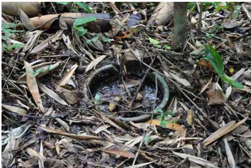
Gambar 15. Tempayan kubur yang hampir keseluruhannya tertanam.

KT4 ini juga hanya terletak beberapa meter daripada KT3 dan masih lagi dalam satu kelompok. Tempayannya 99% tertanam. Hanya bahagian bibir tempayan yang masih kelihatan. Ia dipenuhi dengan air dan keadaan fizikalnya tidak dapat diketahui. Menurut cerita En. Dolius bin Sorudin yang pernah melalui tempat ini bersama 2 orang rakannya sewaktu memburu beberapa tahun lepas, mereka telah dikejar oleh bau mayat sepanjang perjalanan mereka hanya kerana cuba membersihkan tempayan tersebut. Tidak dapat dikenal pasti sama ada pengebumian tempayan tersebut menggunakan kaedah primer ataupun sekunder kerana pengkaji juga tidak menyentuhnya.