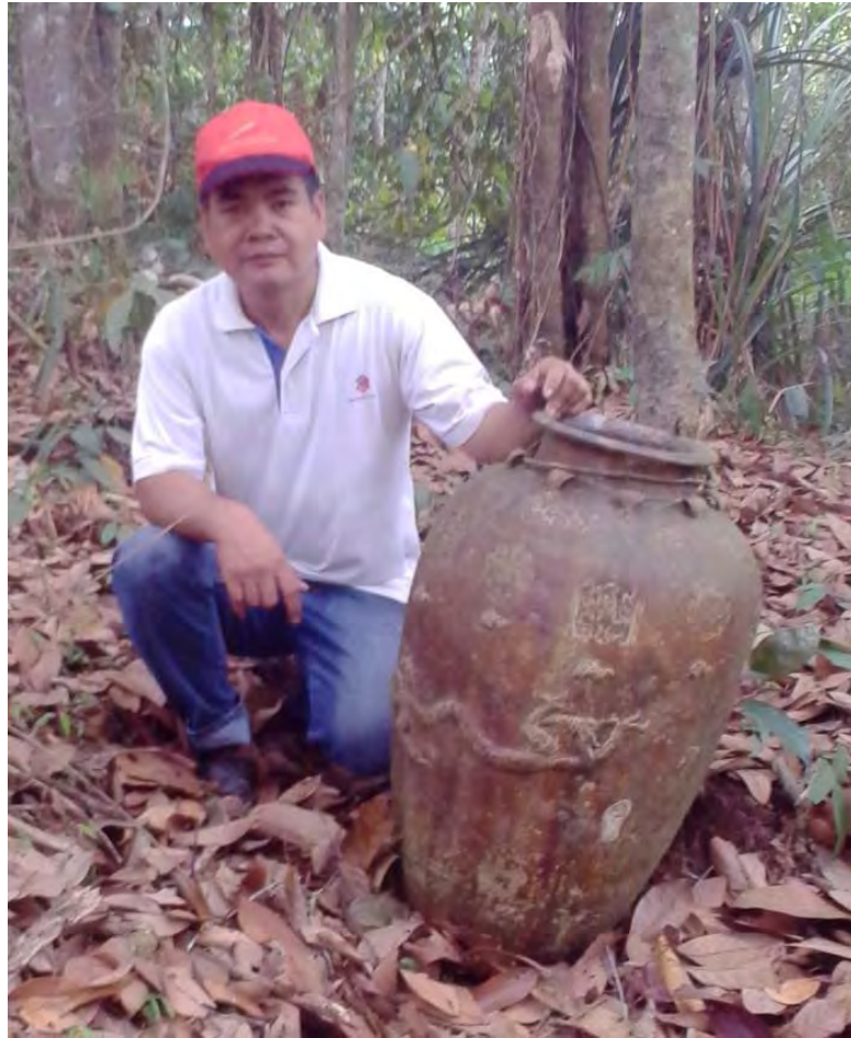
Gambar 18: Tempayan bersama informan di tapak KT6 Kg. Rungus, Tamparuli.

Tempayan kubur ini dijumpai di kawasan perkuburan lama di Kampung Rungus dan dijumpai ketika sebahagian kawasan perkuburan terbakar pada musim kemarau tahun 2016. Pada asalnya sebahagian besar tempayan ini tertanam tetapi kemudiannya terhakis dan pada hari ini hanya tertanam sedalam beberapa sentimeter sahaja. Daripada segi ciri-ciri fizikalnya, tempayan ini mempunyai ketinggian 70 cm dari paras tanah dan diameter bahunya ialah 56 cm. Mempunyai 8 telinga di bahagian bahunya serta bermotif naga di bahagian tengah badannya. Tempayan seperti ini menyerupai tempayan yang berasal dari Vietnam pada abad ke-18 (Harrison, B. 1994) dan wujud dalam masyarakat tempatan sebagai objek budaya yang berharga.