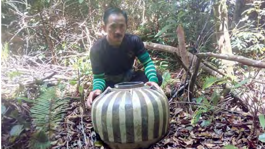
Gambar 16. Tempayan separuh bersepuh yang bercorak jalur di tapak KT5.

telinga di bahagian bahunya. Sebahagian besar permukaan luar tempayan ini bersepuh kecuali di bahagian kaki dan mempunyai corak seperti buah labu. Saiznya juga agak besar iaitu 54 cm diameter di bahagian bahunya. Seperti tempayan kubur yang lain, tempayan ini juga dipotong di bahagian kakinya. Bermakna bahawa kubur ini merupakan jenis pengebumian primer. Sewaktu tinjauan lapangan oleh pengkaji, tempayan ini telahpun teralih daripada kedudukan asal kerana bahagian dasarnya masih melekat pada tanah pokok yang tumbang 2 meter di sebelahnya. Berdasarkan kepada bahagian kaki tempayan yang terdedah itu menunjukkan bahawa bahagian dalam tempayan disepuh atau dicat dengan cara yang paling ringkas sekali.