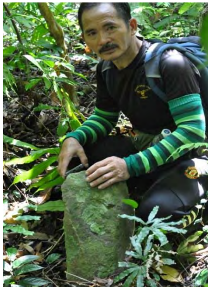
Gambar 3. Batu megalitik 2 yang bersaiz kecil.

Batu megalitik di tapak ini juga merupakan jenis menhir tetapi jauh lebih kecil berbanding TM1. Ia diambil daripada jenis batuan yang sama iaitu batu pasir halus. Daripada segi saiznya, ia hanya mempunyai ketinggian 30 cm dari paras tanah, 13 cm lebar dan 12 cm tebal. Menhir kecil ini juga berfungsi sebagai tingolig dan disebut sebagai tingolig di yonggo dalam bahasa Kadazandusun. Tingolig bermaksud pelindung dan yonggo ialah nama orang yang mendirikan. Sehingga tahun 40-an, acara menjamu batu tersebut masih dilakukan iaitu dengan menyembelih binatang seperti babi dan ayam dan darahnya dialirkan di atas batu tersebut berserta bacaan mantera. Tujuannya adalah untuk menjamin kelangsungan fungsinya sebagai pelindung secara spiritual kepada perkara yang tidak baik daripada masuk ke dalam kawasan kampung. Walau bagaimanapun sudah mula berkurangan apabila kampung ini mula ditinggalkan pada tahun 60-an dan ditinggalkan sepenuhnya pada tahun 80-an.