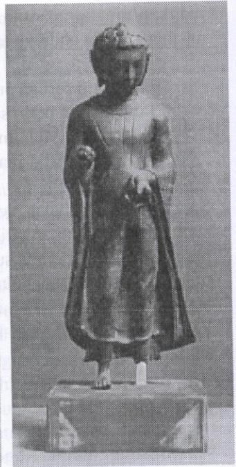
Arca Buddha yang dijumpai di Pengkalan, dekat Ipoh, Perak.