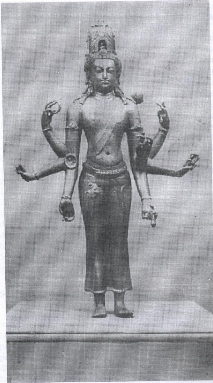
Arca Bodhisatwa Awalokiteswara yang dijumpai di Bidor, Perak (Abad ke 7-10 Masihi).