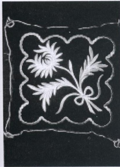
Tekatan, Kuala Kangsar, Perak.