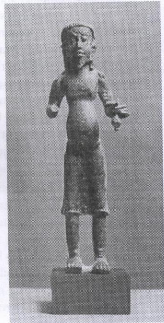
Arca seorang Sami atau Brahmin (mungkin Agastya) yang dijumpai di Jalong, dekat Chemor, Perak (Abad ke 9 Masihi).