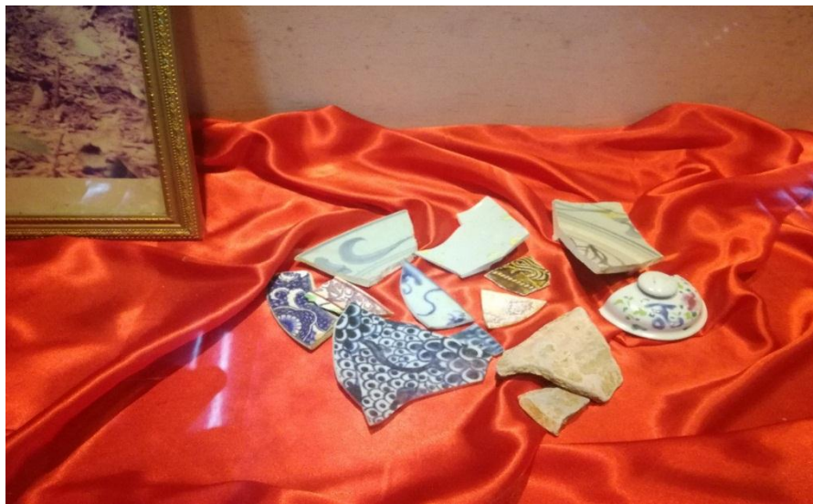
Gambar 2. Serpihan seramik dan tembikar yang dijumpai