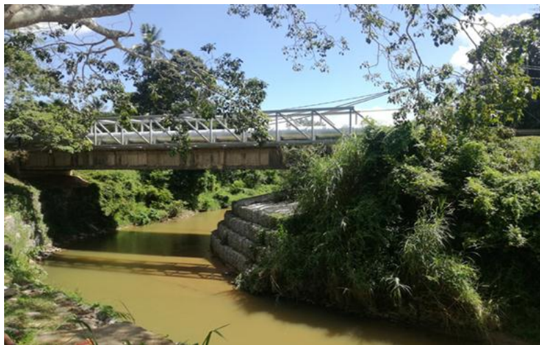
Gambar 4. Sungai Rembau yang dahulunya lebih luas dari sekarang

Menurut penceritaan masyarakat setempat, kawasan Astana Raja ini dahulunya merupakan kawasan yang mempunyai sungai yang luas dan besar, maka tidak hairanlah kapal besar ataupun jong boleh masuk dan mendarat di kawasan ini. Jika dibandingkan kawasan yang dahulunya dengan masa kini, ternyata jauh berbeza mungkin atas faktor perubahan geografi di mana Sungai Rembau yang besar dahulu itu kini sudah kecil (Gambar 4). Segala hujahan ini dapat dibuktikan dengan penemuan beberapa artifak di kawasan tersebut, seperti serpihan seramik dan tembikar.