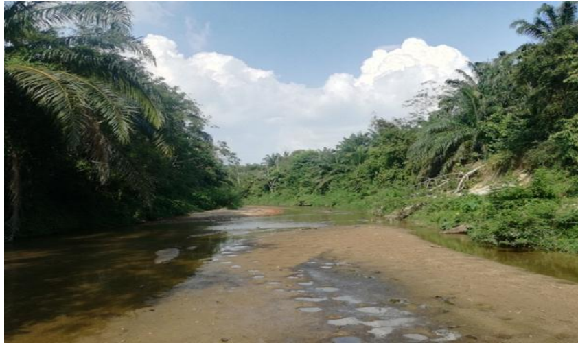
Gambar 3. Sebahagian Sungai Rembau kini yang terletak di Astana Raja