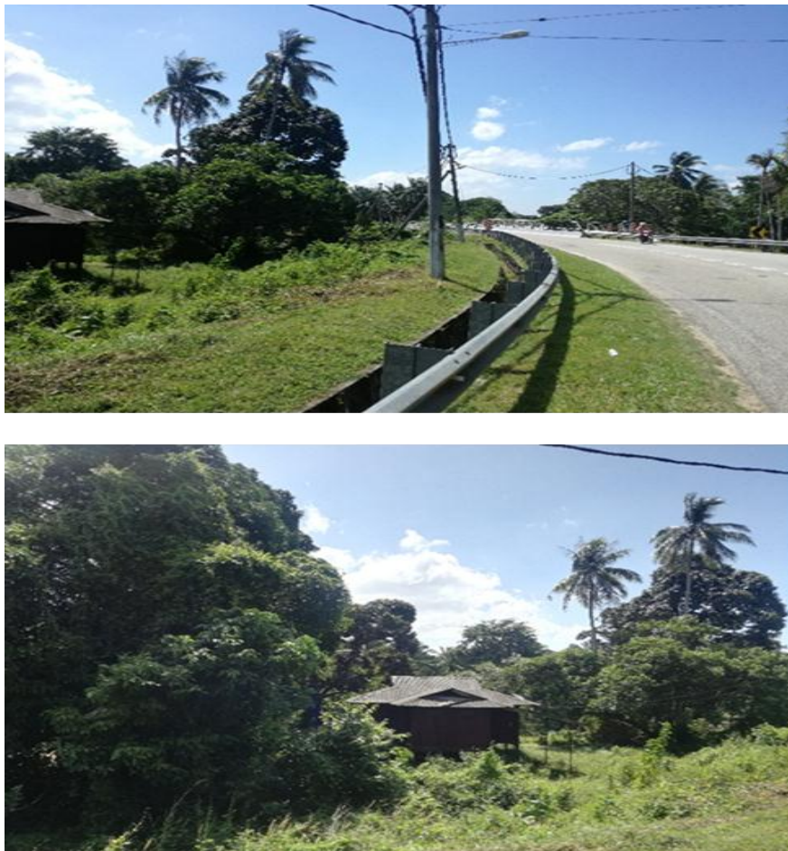
Gambar 5. Dahulunya sebahagian dari Sungai Rembau dan menjadi tempat untuk penukaran laluan kapal

Secara rumusan awal, kajian mengenai kota Raja Melewar ini sepertinya hanyalah bergantung pada kajian-kajian lepas dan catatan-catatan dari 'Abd Halim Nasir'. Oleh yang sedemikian, kajian lanjutan untuk memperbaharui maklumat yang diambil pada ketika dahulu akan dilakukan dengan kerjasama Muzium Negeri Sembilan dan Muzium Rembau yang turut di bantu oleh Institut Alam dan Tamadun Melayu (ATMA) UKM, bagi memelihara sejarah berkaitan Raja Melewar ini khusus dalam aspek pemerintahan beraja di Negeri Sembilan dan juga aspek adat budaya Negeri Sembilan iaitu Adat Perpatih.