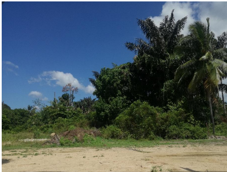
Gambar 1. (Gelanggang Gasing) di belakang inilah terdapatnya tapak kota