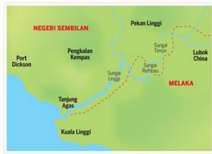
Peta 3. Laluan kemasukan Raja Melewar dari Melaka

Menurut penceritaan masyarakat setempat, kawasan Astana Raja ini dahulunya merupakan kawasan yang mempunyai sungai yang luas dan besar, maka tidak hairanlah kapal besar ataupun jong boleh masuk dan mendarat di kawasan ini. Jika dibandingkan kawasan yang dahulunya dengan masa kini, ternyata jauh berbeza mungkin atas faktor perubahan geografi di mana Sungai Rembau yang besar dahulu itu kini sudah kecil (Gambar 4). Segala hujahan ini dapat dibuktikan dengan penemuan beberapa artifak di kawasan tersebut, seperti serpihan seramik dan tembikar.